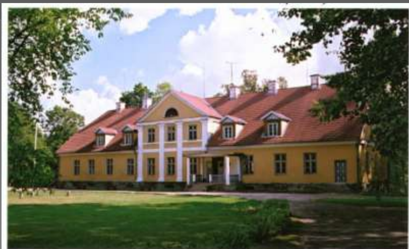
Kool Lahmuse mõisahoones aastast 1926